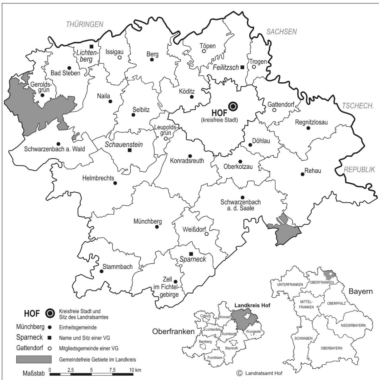
Abbildung 1: Gebiet der LAG Landkreis Hof e.V.

Der Landkreis Hof besteht aus 27 Städten, Märkten und Gemeinden, sowie 37,60 km 2 gemeindefreier Gebiete.